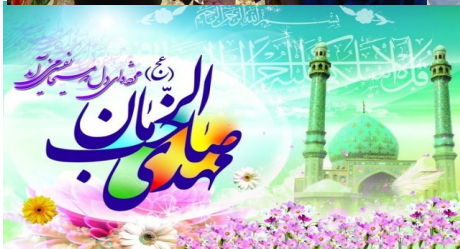
میلاد مسعود مهدی موعود، حضرت امام زمان (عج) مبارک باد