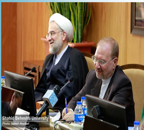
Shahid Beheshti University

ضمناً مقرر شد تیم تحقیقاتی دانشگاه شهید بهشتی به صورت سازمان‌یافته آثار و تبعات سیل را بررسی کند تا در آینده شاهد چنین حوادث ناگواری نباشیم.