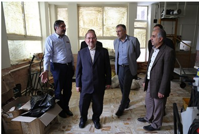
بازدید از محوطه سازی ساختمان دانشکده علوم و فناوری زیستی و پژوهشکده‌های لیزر و پلاسما و گیاهان و مواد اولیه دارویی و محوطه سازی اطراف استخر دانشگاه

به گزارش روابط عمومی و اطلاع رسانی دانشگاه، رئیس دانشگاه شهید بهشتی بعد از ظهر روز شنبه ۱۲ خرداد ۱۳۹۷ از قسمت‌هایی از عملیات و طرح‌های عمرانی در دست اجرا در پردیس ولنجک دانشگاه بازدید میدانی به عمل آورد.