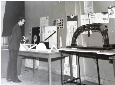
قسمتی از کارگاه مقاومت مصالح در دانشکده معماری، دهه ۱۳۴۰ شمسی