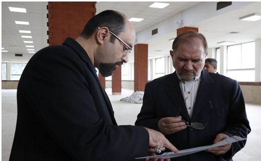
بازدید از طرح توسعه شرکت هوشمند اول بهشتی