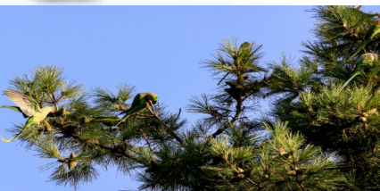
نمایی از طوطی ها بر شاخ و برگ درختان دانشگاه شهید بهشتی