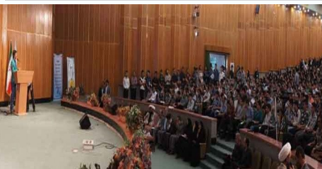
تالار ابوریحان دانشگاه شهید بهشتی در سال ۱۳۹۰