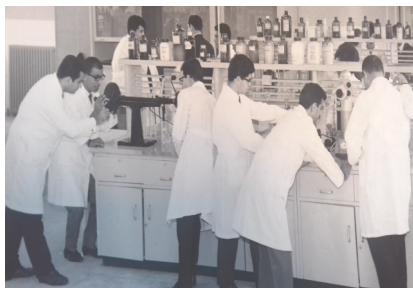
یکی از آزمایشگاه‌های دانشگاه شهید بهشتی در دهه ۱۳۴۰ شمسی